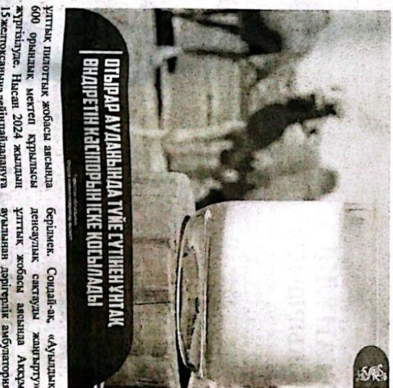
ОТЫРАР АУДАНЫНДА ТҮЙЕ СҮТІНЕН ҰНТАҚ ӨНДІРЕТІН КӘСІПОРЫН ІСКЕ КОСЫААДЫ

бірлесіп 500 гектар алқапқа тақ-шалақты суару әдісімен мектеп дайқалын ету жұмыстарын жүргізіліп, 1 200 тонна мектеп өнімі алынды. Сонымен қатар, ауданда жыл соңына дейін 800 млн теңгеге сұра саласы бойынша екі шағын инвестициялық жобаны іске қосу жоспарланып отыр. Бұдан бөлек, 2025 жылғы қыркүйектен бастап құрылған түіе сүтін өсілеп, ұнтақ шығаратын кәсіпорын құру көзделген. Бүгінде инвесторлармен келіссөздер жүргізілуде. Сондай-ақ, 2025-2030 жылдары қыркүйек 145 млрд 625 млн теңгеге құрылған 157 ірі және шағын инвестициялық жобалар жүзеге асып, 1 790 адам жұмыспен қамтылады. Сондай-ақ, келесі жылы ауданда «Неола» ЖШС-ің демалыс аймағы іске қосылады. Ал, 2026 жылғы «Жаңа» ЖШС-ің ендік башпак пен жылқы сүтін өсілеу орталығын іске қосу көзделген»-деп бұдан бастайды.